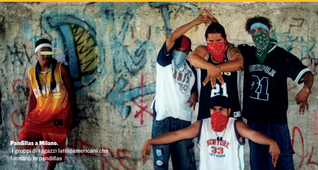
Pandillas a Milano. I gruppi di ragazzi latinoamericani che formano le pandillas