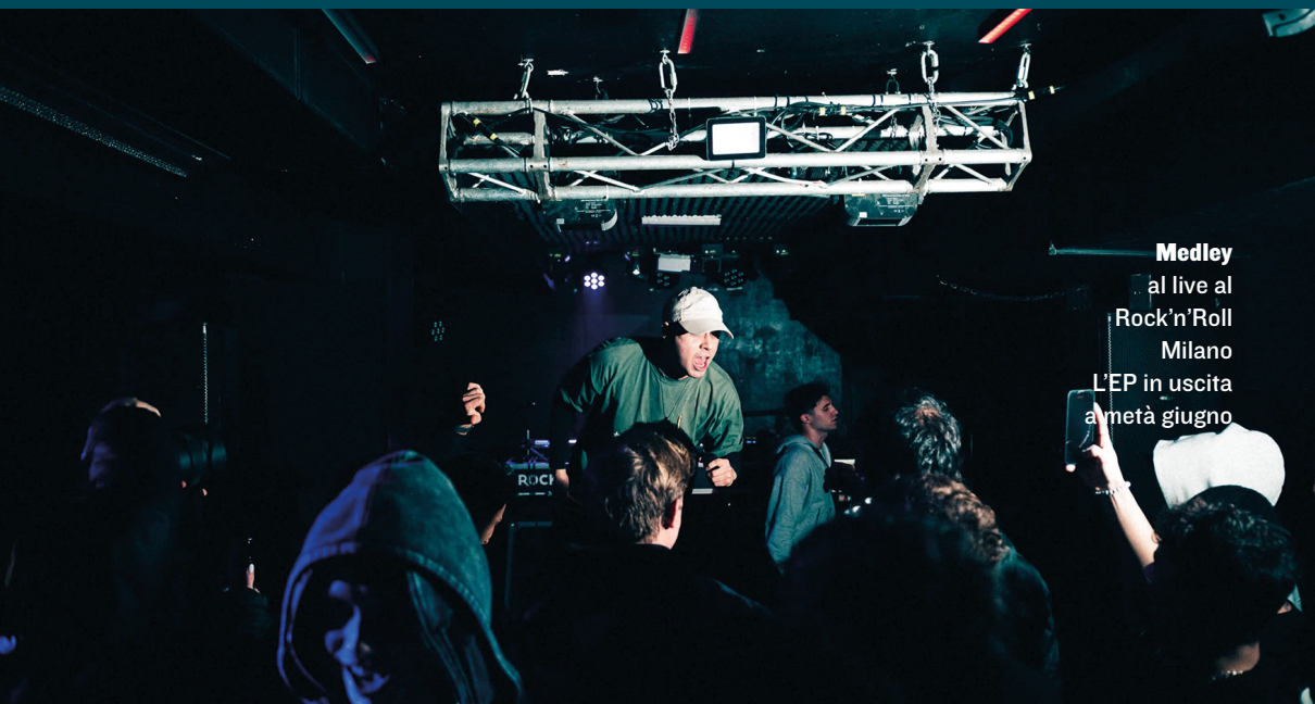
Medley al live al Rock'n'Roll Milano L'EP in uscita a metà giugno